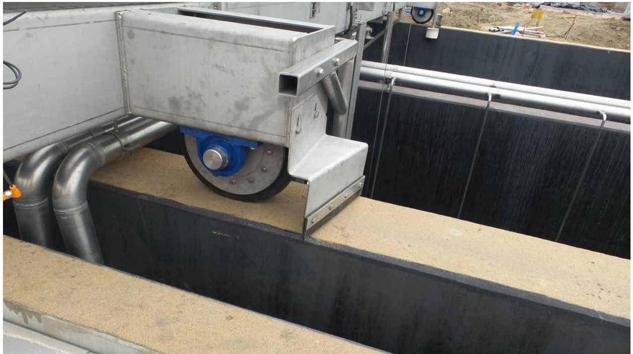
Obiekt nr 8 – zbiornik retencyjny