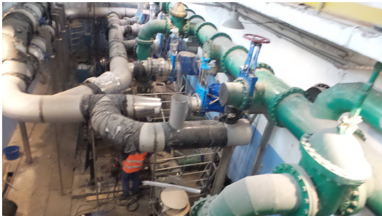
Obiekt nr 5 – stacja zlewna ścieków dowożonych.