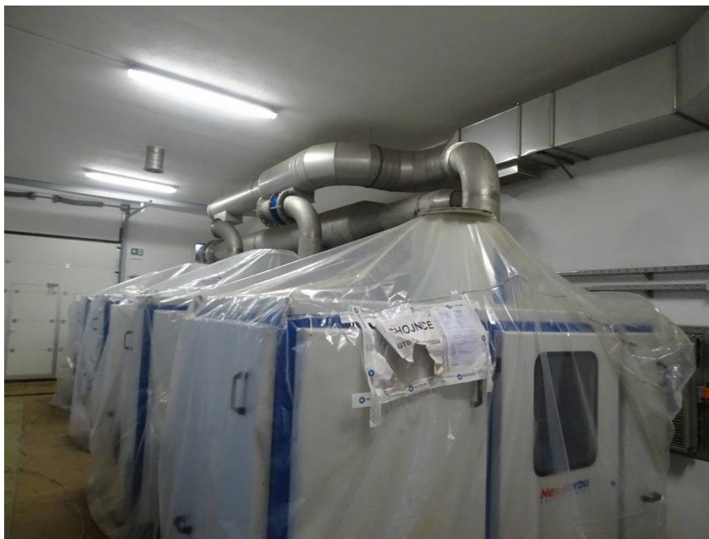
Obiekt nr 3 – garaże.